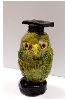
Uglan er úr leir og eftir nemanda í vali.