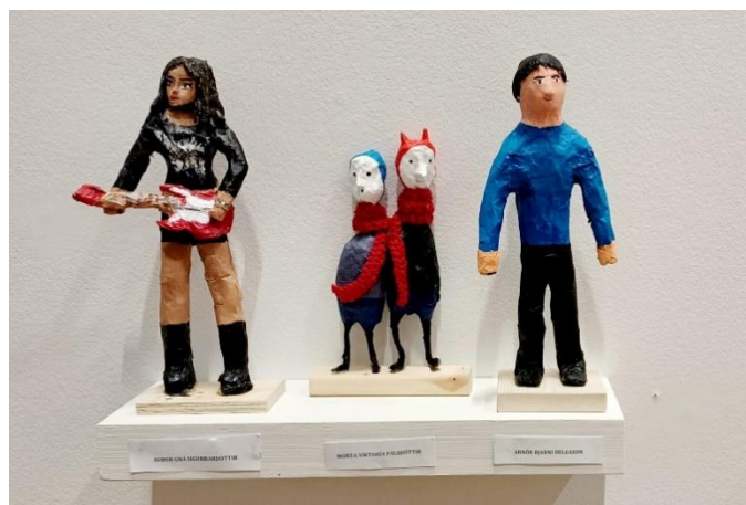
Verk eftir nemendur í vali, verkin voru sýnd á sýningunni Sköpun Bernskunnar í Listasafninu á Akureyri