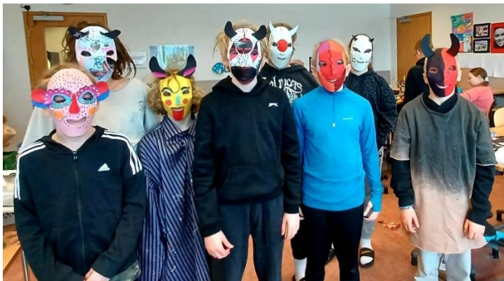
Grimugerð með 5. bekk