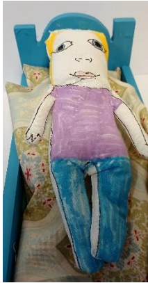
Einstaklingsverkefni unnið af nemanda í 6. bekk