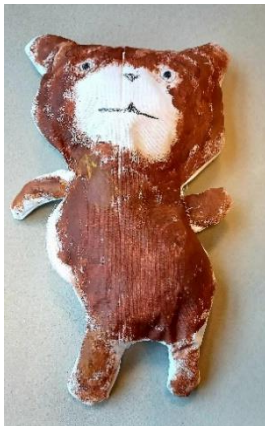
Bangsinn er eftir nemanda í 4. Bekk