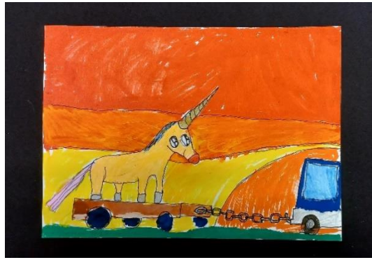
Verk eftir nemanda í 4. bekk