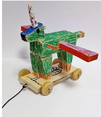
Hjólhestur eftir nemanda í 5. bekk