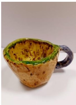
Leirmótun, bolli eftir nemanda í 7. bekk