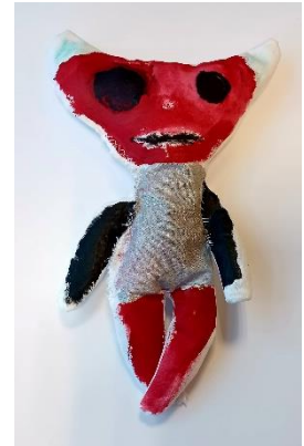
Mynd 3 Saumuð dúkka eftir nemanda í 4. bekk