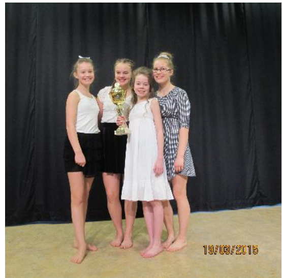
Sigurvegarar í Brekkuvision hæfileikakeppninni í 5. - 7. bekk

Að þessu sinni kom ekkert atriði frá 10. árgangi en 8. og 9. árgangur héldu hæfileikahátíð sem heppnaðist mjög vel. Breytingin er ef til vill upptaktur að því sem koma skal í framtíðinni þar sem dregið verður úr keppni milli árganga/námshópa og ríkari áhersla lögð á almennari þátttöku. Haldin verði hátíð þar sem allir eru í raun sigurvegarar í stað keppni.