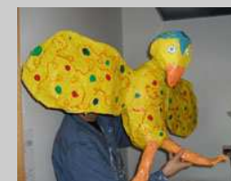
Fuglaverkefni í myndmennt

Skráning á námskeiðin er hjá umsónarkennurum.