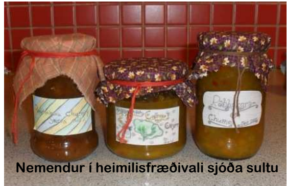
Nemendur í heimilisfræðivali sjóða sultu

Þegar kólnar í veðri þarf að gera ráð fyrir hlýrri fatnaði til útivistar. Alltaf er gott að hafa auka sokkar og hlífðarbuxur í skólatöskunni.