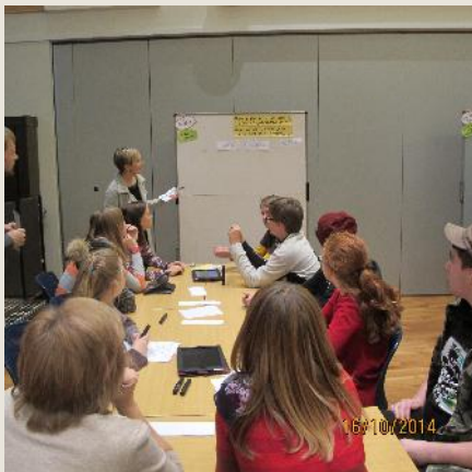
Atriði á miðum rædd og flokkuð