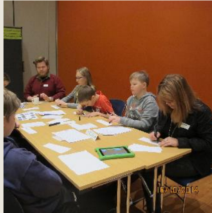
Hver hópur skráði hugmyndir sínar um svör við spurningum sem lagðar höfðu verið fyrir þingið.