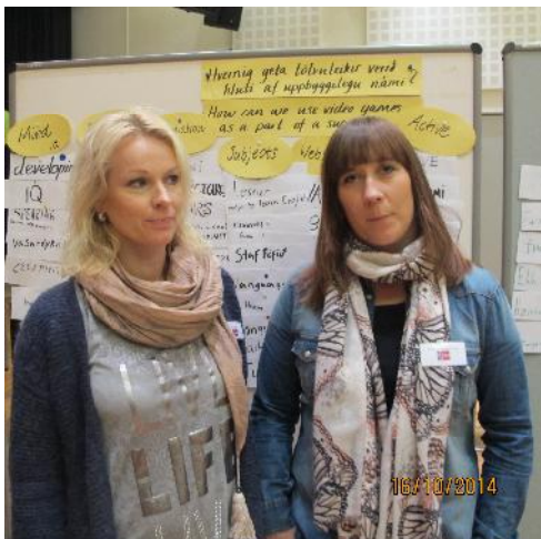
Nordpluskennaramir tóku þátt í skólalþinginu.

Myndir og fleira tengt verkefninu á http://iclan.blogspot.com