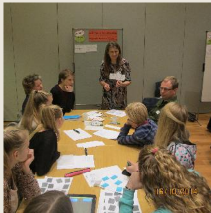
Alfa forstöðumaður æskulýðs- og forvarnarmála og Guðjón foreldri og fulltrúi úr nærsamfélagi skólans MA sátu einnig þingið.