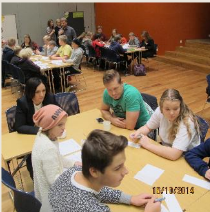
Margir góðir gestir voru á þinginu, Gulli forvarnarfulltrúi skólans, Vaka frá Mentor og Nordplus-gestirnir svo dæmi sé tekið.