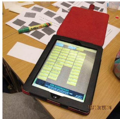
Nordplus notar smáforritið "lino" á Skólalþingi