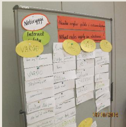
Afrakstur verður skráður rafrænt, ræddur og nýttur. Nordplus-valgreinin hefur umsjón með því verkefni.

Áð þessu sinni tóku samstarfsskólar okkar í Nordplusverkefninu þátt í skólaþingi með okkur enda viðfangsefnið ekki bundið við landamæri.